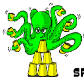
FREDERIKSBERG SPORT STACKING KLUB